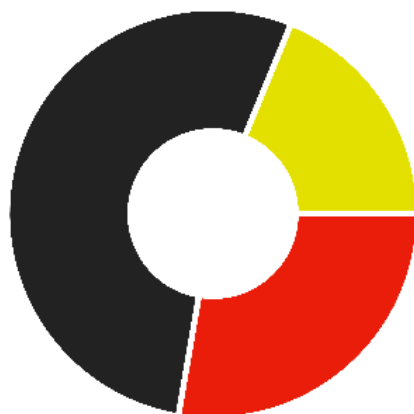
Ekvivalens energia fogyasztás

Villamos energia: Földgáz: 528 453 kWh 358 741,67 kWh Gázolaj: 1 020 573,608 kWh