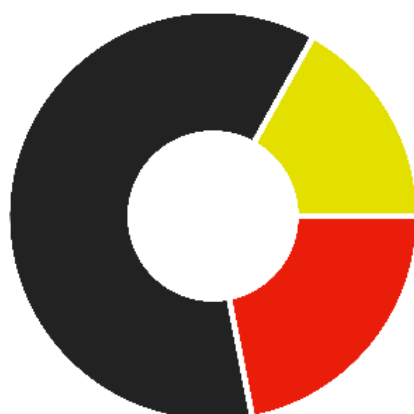
Ekvivalens energia fogyasztás

Villamos energia: 449 322,03 kWh Földgáz: 346 184,47 kWh Gázolaj: 1 253 195,123 kWh